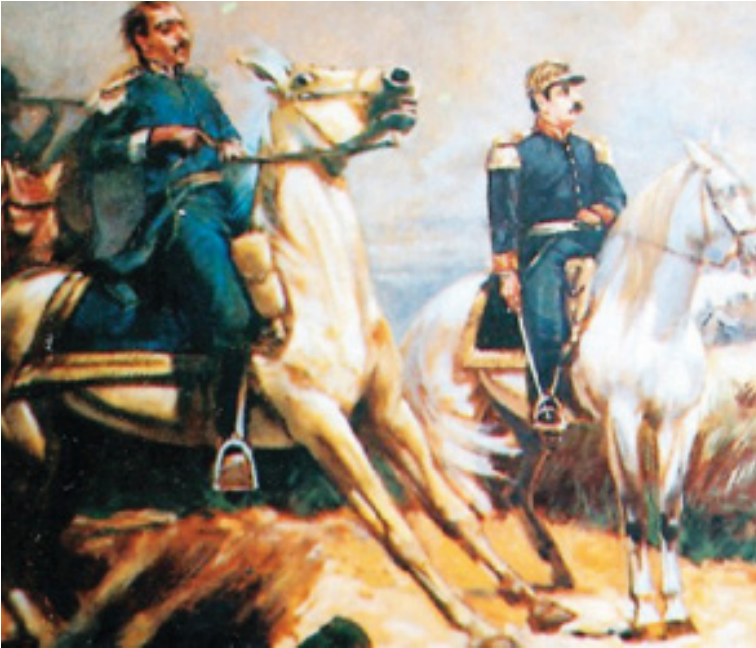
Batalla de Santa Inés (s/f), por Iván Belsky