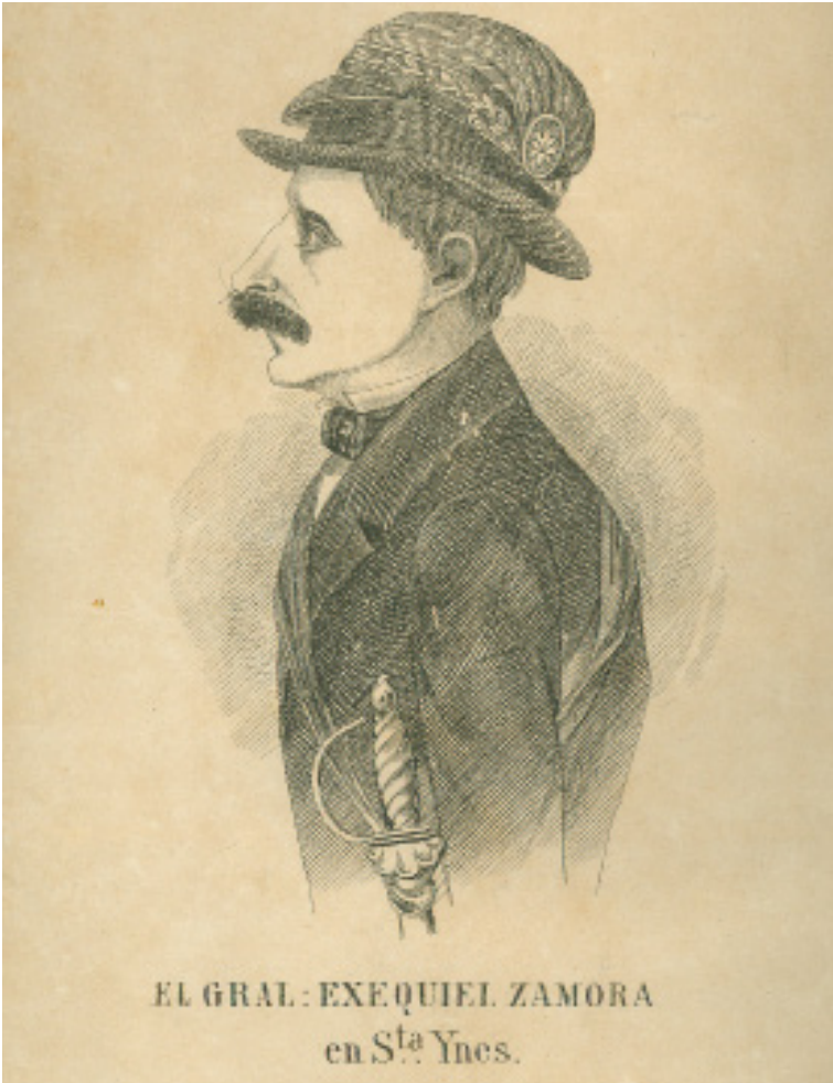
EL GRAL. : EXEQUIEL ZAMORA en Sta Ynes.